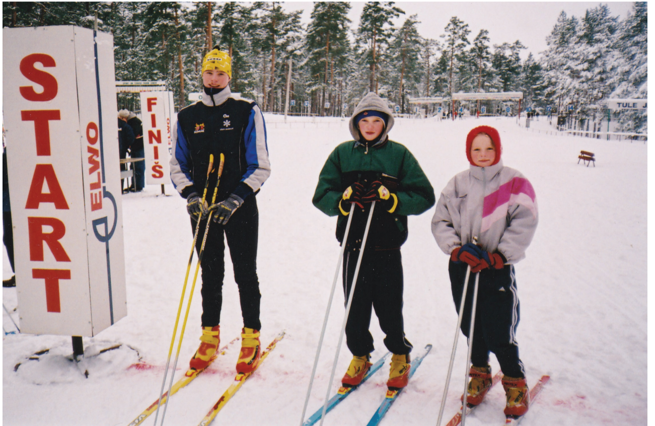
Kein venna ja õega Jõulumäel 2001. aastal. Nii need sportlikud lapsed kasvavad.

Mu tütreid on hetkel väga oma suusatamise tee alguses. Vanem tütar (nelja aastane) on väga tubli mäesuusatamises ja naudib seda meeletult hetkel. Murdmaasuusatamine kindlasti pole ta lemmiktegevuste topp kolmes. Aga me ikkagi aeg-ajalt käime ühiselt suusatamas. Noorem tütar (kahe aastane) on pigem proovimise ja uudistamise faasis mõlema spordialaga ja pigem hetkel jäljendab vanemat õde.