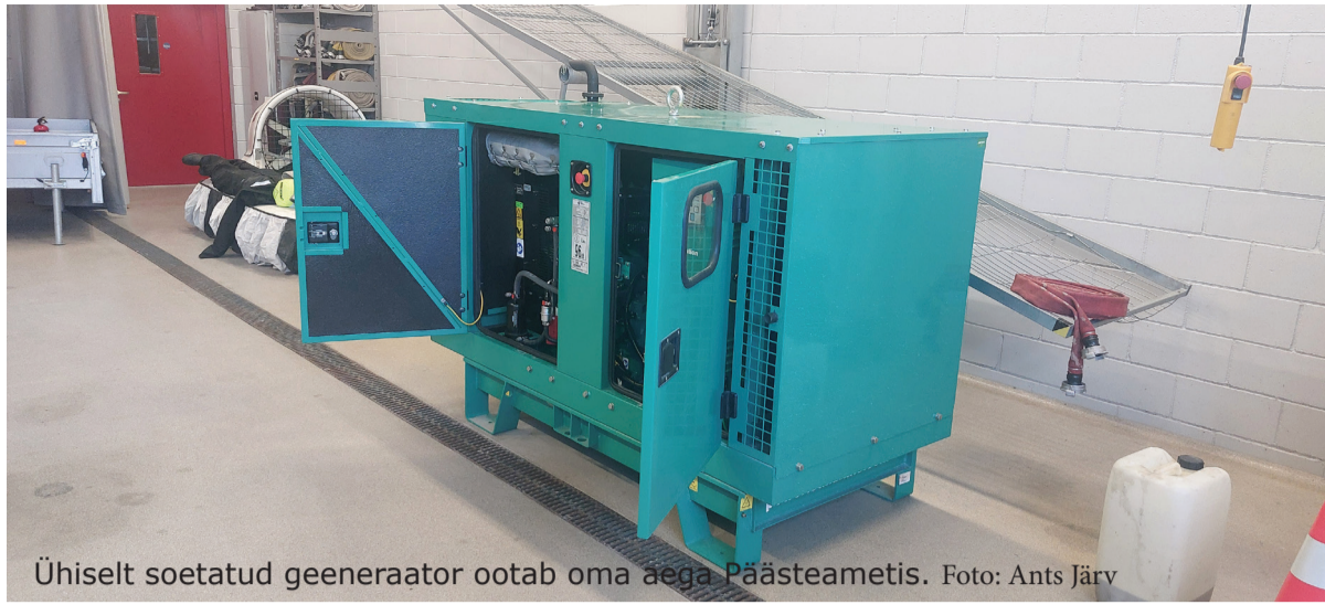
Ühiselt soetatud generaator ootab oma aega Päästeametis.