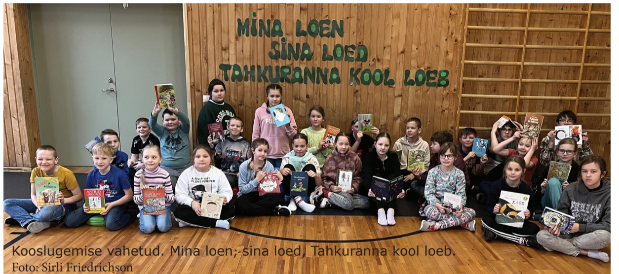
Kooslugemise vahetud. Mina loen, sina loed, Tahkuranna kool loeb.