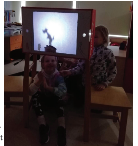
Varjuteater.