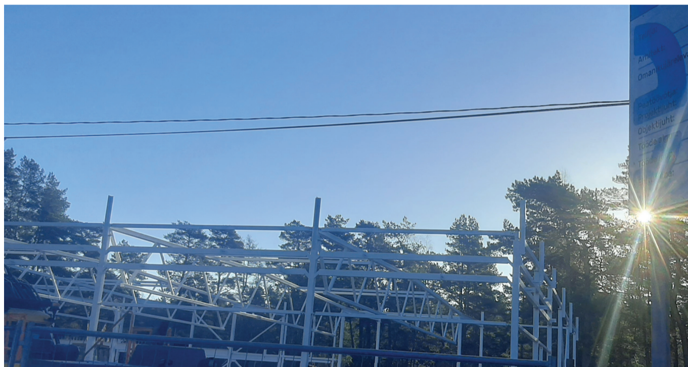
Uus kauplus peaks valmima jaanipäevaks.

prügilepingut. Ta ütles lausa, et see pole veel kõik ja „suvilakaupa“ võibki hakata tekkima tänu uuele prügiseadusele ka metsa alla. „Riputasin fotod üles kogukonna veebilehele.“