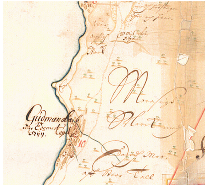
Fragment Pärnu kreisi kaardist, 1684. Häädemeeste eestikeelse nimeteadaolev esmamainimine. EAA f 308, n 2, s 14.

Muinasaja lõpul oli hilisema Häädemeeste kihelkonna territoorium hõredalt asustatud, mida iseloomustab siin ka muinasaegse arheoloogilise leiutamaterjali puudumine. Häädemeeste kihelkond kuulus ühe arvamuse kohaselt liivlastega asustatud muistse Metsapole (Salatsi) maakonna koosseisu, teise seisukoha järgi aga jagatuna Metsapole ja Soontagana maakonna vahel. Seega ollakse eriarvamusel ka liivlaste asustuse leviku ulatuse üle. Selle piiriks on peetud kuni Pärnuni ulatuvat Liivi lahe lõunapoolset rannäärset ala, teisalt on see piir asetatud Orajõe juurest Laigaste ninani. Viimane seisukoht toetub 1259 eestlaste ja liivlaste vahelisele lepingule, millega määrati kindlaks nende omavaheline piir. Nii või teisiti on selge, et Häädemeeste alale jäi Salatsi liivlaste asustuse põhjapoolne piir. See aga ei tähenda, et praegused Häädemeeste elanikud oleksid liivlaste järeltulijad, sest nagu edaspidi näeme, on siin asustus kohati mitmel korral katkenud.