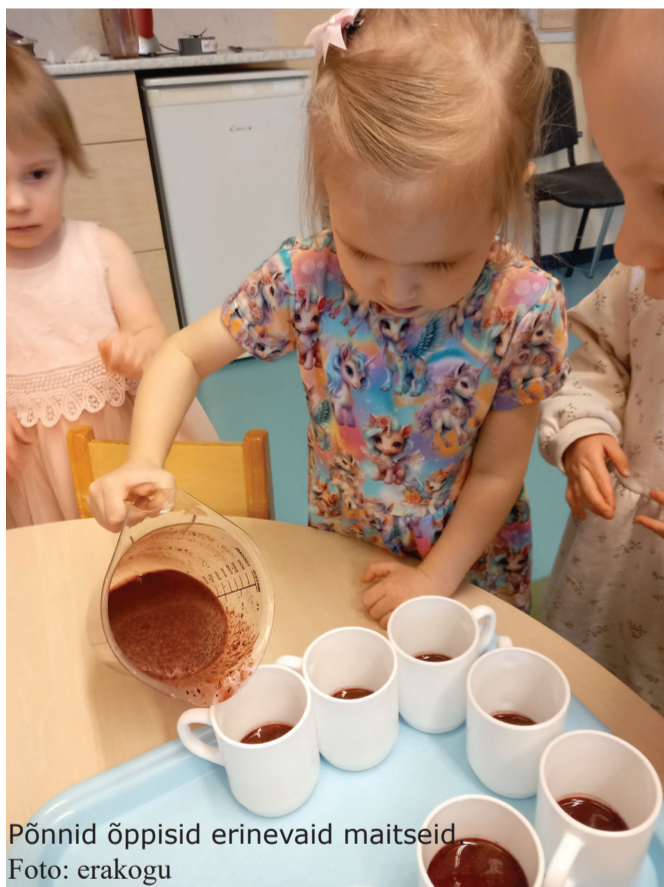
Põnnid õppisid erinevaid maitseid.

Veebruari lõpus tähistasid kõik rühmad Eestimaa sünnipäeva. Lapsed olid sel päeval kodus end pidulikult riidesse pannud. Sipelgate ja Jaanimardikate rühma peol jutustas Jututriinu lastele loo sõpradest Jänese ja Oravast. Põrnikate, Lepatriinude, Mesimummide ja Liblikate