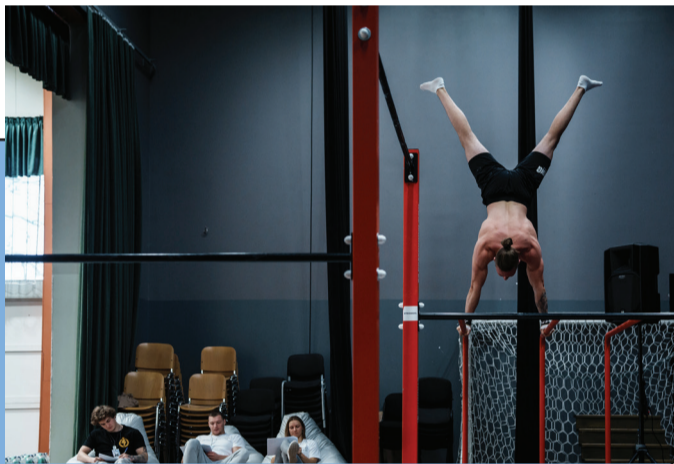
Aasta pressifoto spordikategoorias, klõpsti Uulust.