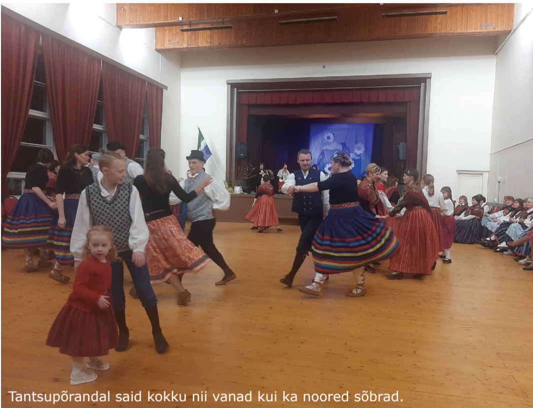
Tantsupõrandal said kokku nii vanad kui ka noored sõbrad.